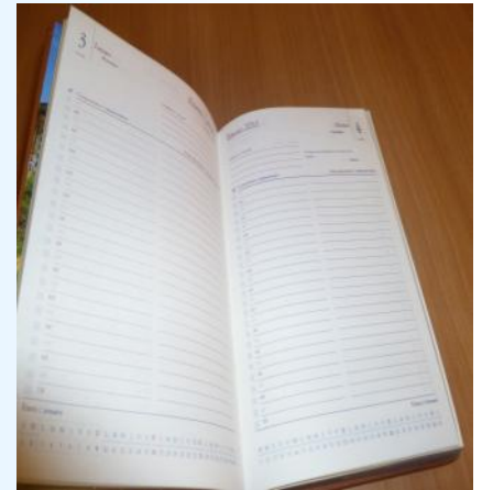
Disponible en color vino. No ilustrada.

El CPR tiene disponibles Agendas 2011 con el logo de tu Colegio de los Profesionales de la Consejería en Rehabilitación. A un costo de $20.00 dólares y cinco (5) variedades a escoger. Para obtener la suya puede comunicarse a la oficina del CPR al (787) 751-2280 de martes a jueves de 1:00 pm a 6:00 pm.